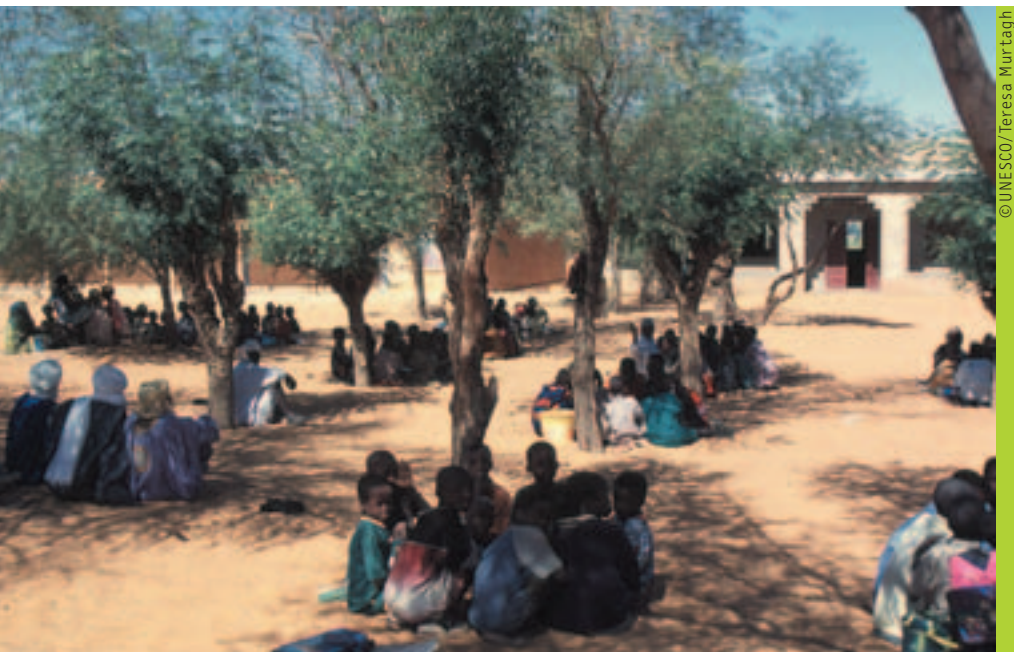
La merienda escolar motiva a los niños a asistir a la escuela en forma regular.

Contactos: Edouard Matoko, UNESCO/Bamako E-mail: f.matoko@unesco.org ; y Ute Meir, UNESCO/París E-mail: u.meir@unesco.org